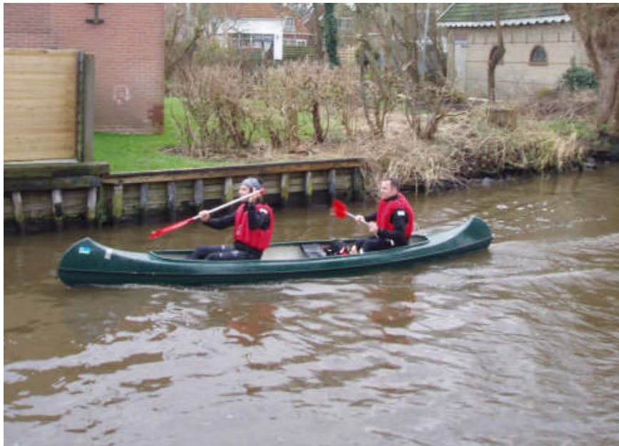
Met de canadees dwars door Woudsend

Maar al snel vind ik de ontbrekende luchtfoto in mijn mapje en peddelen we net als de rest weer verder over het Heegermeer richting Woudsend. Bij de brug in Woudsend doemt plotseling een survivalnet boven ons op. Een van ons moet de boot verlaten om via het net de brug te betreden. Boven op de brug krijgen we een kompascoers door die we moeten volgen op het moment dat we via de Ee het Slotermeer op varen. Via een touw daal ik weer af in de boot wetende dat we voorlopig nog geen afscheid zullen nemen van onze canadees.